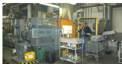
Metallgießerei Dicke in Gevelsberg

Gerade die extrem schwankenden Rohstoffpreise führen zu hohen Anforderungen an Einkauf und Kalkulation: Die MTZ/ETZ-Verwaltung in TimeLine-GUSS unterstützt die Hinterlegung von kundenbezogenen bzw. allgemein kalkulierten Basispreisen und kundenbezogenen bzw. allgemeinen MTZ/ETZ-Kursen.